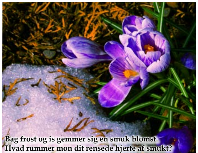
Bag frost og is gemmer sig en smuk blomst. Hvad rummer mon dit rensede hjerte af smukt?

Hun takkede mange gange for, at hun havde fået lov til at komme på besøg, og for at smeden havde taget sig tid til at fortælle så meget om sit arbejde for hende. Men lige da hun skulle til at forlade smedjen, råbte smeden efter hende. "For resten, der var lige en ting, jeg glemte at fortælle. Jeg ved, at renselsesprocessen er færdig, når jeg kan se mit eget spejlbillede i sølvet."